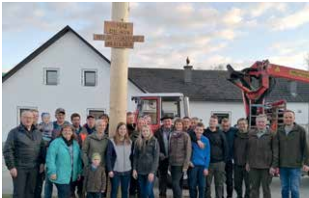
HÖHENBERG - Der Maibaum wurde am 30. April von der Dorfbevölkerung aufgestellt. Die Kinder konnten ihren eigenen Maibaum aufstellen.