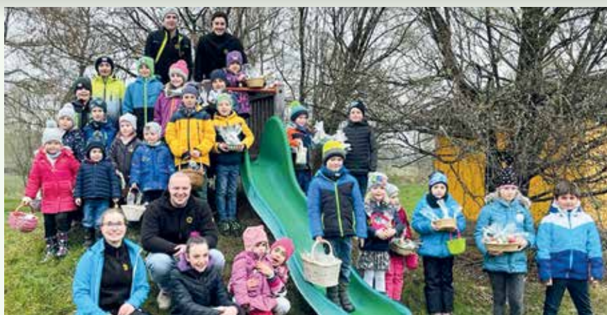
Ein fröhliches Ostereiersuchen gab es am Karsamstag am Spielplatz.

Nach der Corona-Pause fand heuer wieder der beliebte Faschingsumzug unter dem Motto „Cowboy und Indianer“ statt. Die gesammelten Spenden von insgesamt 1.500,- Euro ergehen an die St. Anna Kinderkrebsforschung.