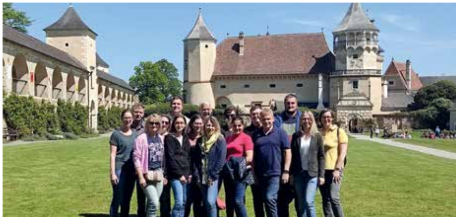
Willkommen auf der Rosenburg! Nach einer ins Mittelalter zurückreichenden Führung und einer beflügelnden Greifvogelschau genoss man die Sonne im Burghof.

Vierzehn Mitarbeiter der Marktgemeinde Großdietmanns schafften es heuer, nach sieben Jahren wieder einmal gemeinsam einen Tag zu verbringen. Es ging zur mittelalterlichen Rosenburg im Bezirk Horn und ins LOISIUM nach Langenlois.