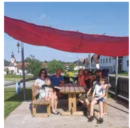
Die Eltern und Kinder von Hörmanns können sich über ein neues Sonnensegel über dem Jausentisch beim Spielplatz Hörmanns freuen.