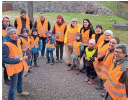
Viele Müllsammler fanden sich auch in Wielands ein.

Es wurden vier Säcke Müll und einige Plakate, die von der Wahl übrig geblieben sind und vom Wind verweht wurden, gesammelt.