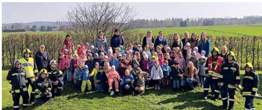
Die Kinder mit den Feuerwehrleuten aus Dietmanns im Garten des Kindergartens nach der gut abgelaufenen Feuerwehrrübung.

In der Zeit davor wurden die Kinder darauf vorbereitet und das Thema Feuer und Feuerwehr in den Mittelpunkt gestellt. Ein besonderes Erlebnis war das Mitfahren mit