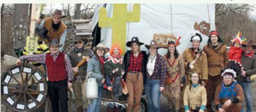
Cowboy und Indianer waren in Eichberg beim Faschingsumzug unterwegs.