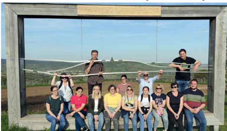
Ein Portrait von den Mitarbeitern der Marktgemeinde Großdietmanns, die an diesem Tag gemeinsam in den Weinhängen von Langenlois wanderten.

den Weinwanderweg entlang durch die Weinhänge rund um Langenlois.