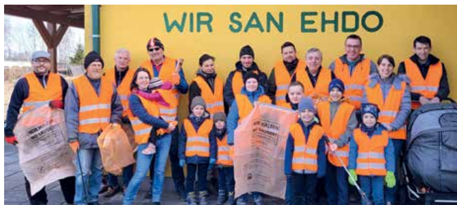
In Ehrendorf ist man hoch motiviert, den achtlos weggeworfenen Müll einzusammeln und fachgerecht zu entsorgen.

Die FF Unterlembach lud im Anschluss zu einer kleinen Jause. Ein Dankeschön an alle freiwilligen Müllsammler!