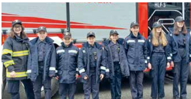
Die erfolgreiche Feuerwehrjugend Eichberg bei den Wettbewerben in Heidenreichstein.

Vorstellung des neuen Feuerwehrhauses und das Wissen der Jugendfeuerwehr stand am Prüfstand.