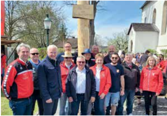
DIETMANNS - Die Dietmannser Vereine stellten traditionell am 1. Mai den Maibaum auf.