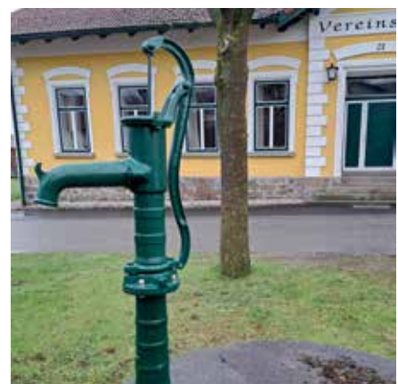
Die Aktivierung des Hausbrunnens beim Vereinshaus Wielands erfolgte im April. Die erforderliche Handpumpe wurde von der Gemeinde Großdietmanns zur Verfügung gestellt. Somit hat Wielands einen NUTZWASSERBRUNNEN für alle Bewohner der Ortschaft direkt im Ortskern.