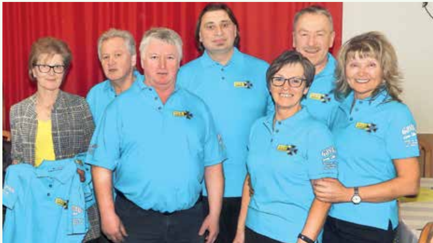
Die neuen T-Shirts wurden gleich mit Begeisterung anprobiert!

Sonntag den 17. September 2023 „Frühschoppen in der Brucknerhalle“