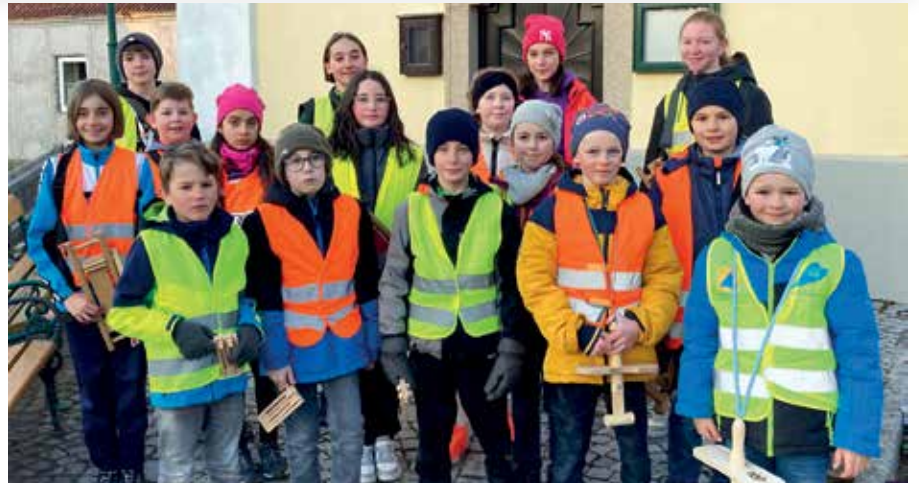
Die Kinder von Eichberg waren wieder am Karfreitag und Karsamstag mit ihren Ratschen unterwegs.