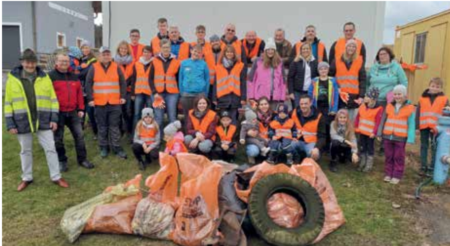
Die fleißigen Unterlembacher mit ihrem Müllberg nach dem Einsammeln im gesamten Ortsgebiet.

Die Aktion „Stopp littering“ wurde in den Katastralgemeinden Ehrendorf, Unterlembach und Wielands auch heuer wieder erfolgreich durchgeführt.