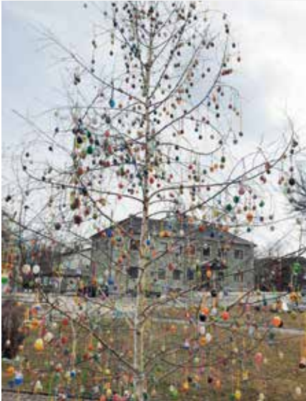
Der Dietmannser Osterbaum mit gebastelten Ostereiern der Kindergarten- und Volksschulkinder wird vom Dorferneuerungsverein aufgestellt.