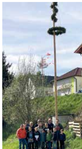
UNTERLEMBACH - In Unterlembach wurde der Maibaum am 1. Mai aufgestellt. Im Anschluss gab es einen gemütlichen Frühlingsessen mit Grillhühner.