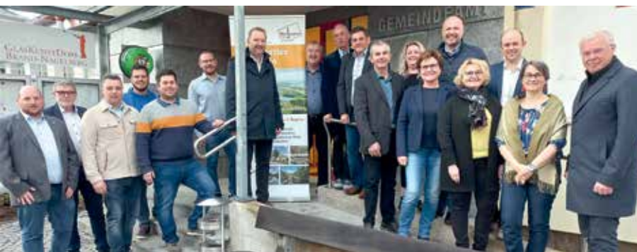
Der Vorstand präsentiert sich vor dem Gemeindeamt Brand-Nagelberg.

An einer liebevoll gedeckten Tafel wurden die selbst gemachten Snacks anschließend gemeinsam verkostet.