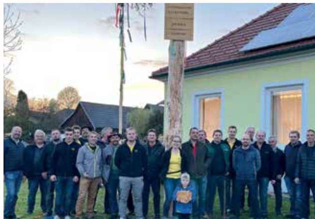
EICHBERG - Die Eichberger Kinder präsentierten stolz ihren eigenen Maibaum. Ein Hoch der Dorfbevölkerung, die den Maibaum gemeinsam mit den Organisatoren-Team der EWOKS am 30. April aufstellte. Nach getaner Arbeit wurde gemütlich gefeiert.