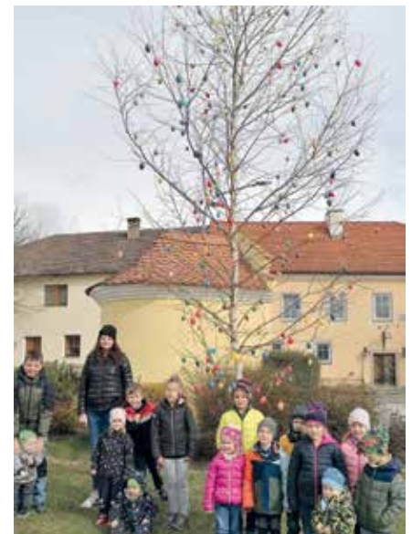
In Höhenberg am Dorfplatz stand der Osterbaum mit den von den Kindern gebastelten Ostereiern.