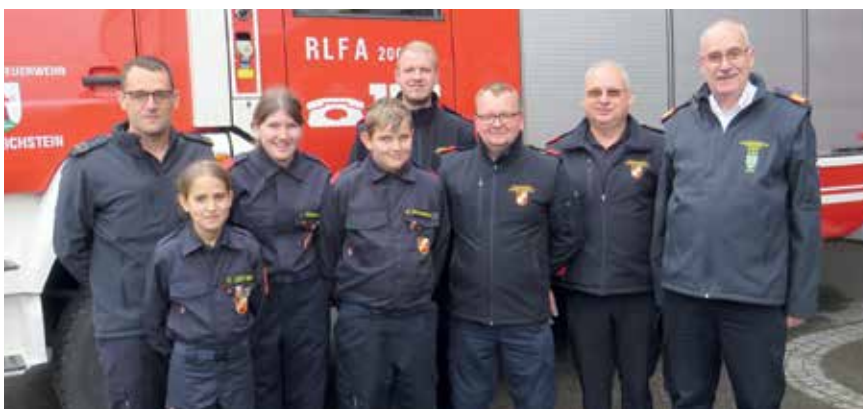
Das stolze Kommando mit den erfolgreichen Teilnehmern in Heidenreichstein.

Mit einer Leistung von 60 kVA kann somit im Falle eines Stromausfalles problemlos das Feuerwehrhaus versorgt und dieses somit als Notinsel für die Ortsbewohner von Unterlembach betrieben werden.