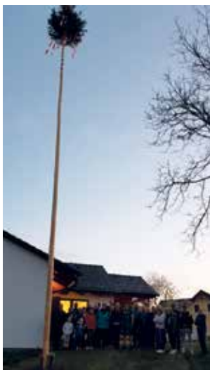
REINPOLZ - Beim neuen Dorfhaus wurde der Maibaum am 30. April aufgestellt.