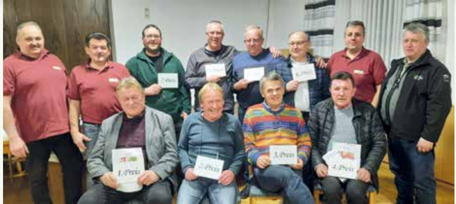
Der ÖKB konnte sich über eine rege Teilnahme beim heurigen Gesellschafts- und Zankerlschnapsen freuen.

begrüßte die anwesenden Kameraden zur Jahreshauptversammlung, die am 18. März im Gasthaus „zum Zacky“ stattfand.