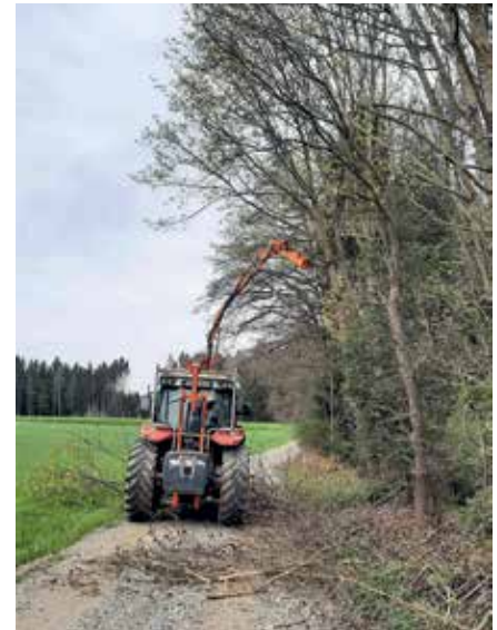
Die Hörmanner Güterwege wurden von herabhängenden Ästen und in den Weg wachsenden Sträuchern befreit.