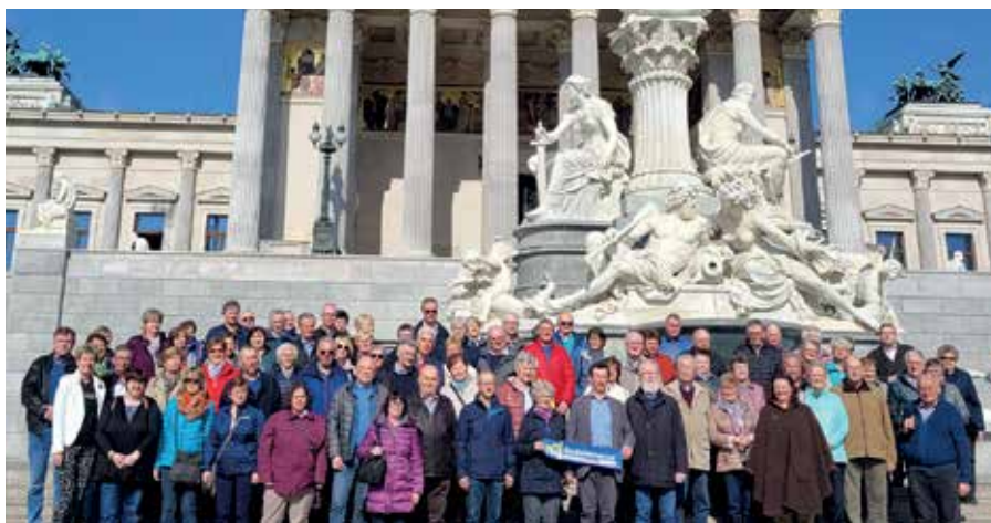
Die Dietmannser Senioren vor dem österreichischen Parlament am Wiener Ring.