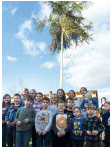
EHRENDORF - Die Kinder stellten in Ehrendorf ihren eigenen Maibaum auf und auch die Großen waren eifrig beim Aufstellen am 30. April.